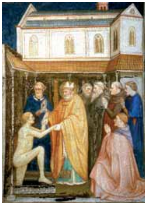
Cud św. Stanisława, fresk Puccio Capanny z XIV w., bazylika św. Franciszka w Asyżu