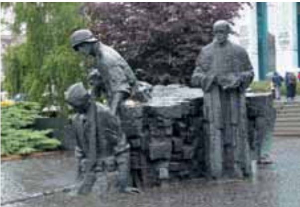
Pomnik Powstania Warszawskiego, powstańcy wchodzący do kanału, Warszawa

Wśród walczących było wielu młodych Polaków, którzy pokazali, że los Ojczyzny jest dla nich ważny, że ich miłości do kraju nie da się łatwo zniszczyć, że gotowi są dla niej poświęcić własne życie.