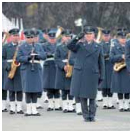
Parada wojskowa podczas obchodów Święta Niepodległości w Warszawie