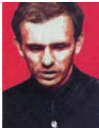
Bł. ks. Jerzy Popiełuszko

Ksiądz Jerzy Popiełuszko urodził się 14 września 1947 r. w podlaskiej wsi Okopy. W 1965 r. wstąpił do seminarium duchownego w Warszawie. Jako kapłan opiekował się duszpastersko chorymi i personelem jednego ze szpitali. Od sierpnia 1980 r. był duszpasterzem robotników Huty „Warszawa”. Był to czas, kiedy Polacy jawnie buntowali się przeciwko władzy komunistycznej. Podczas wielodniowych strajków hutników ks. Jerzy pozostawał z nimi dzień i noc. Odprawiał Msze Święte, spowiadał, rozmawiał, uspokajał wzburzonych, zachęcał do miłości i przebaczenia. Od stycznia 1982 r. w ostatnie niedziele miesiąca odprawiał Msze Święte w intencji Ojczyzny z udziałem rzesz wiernych z różnych stron Polski. W homiliach głosił chrześcijańskie prawo do sprawiedliwości społecznej, wolności, prawdy i miłości. Bronił podstawowych praw ludzkich i godności człowieka jako dziecka Bożego. Jego wypowiedzi były zdecydowane i odważne. Przypominał biblijną zasadę: „Zło dobrem zwyciężaj” (Rz 12,21).