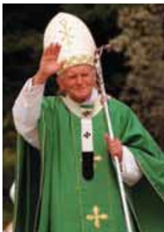
Św. Jan Paweł II

Polacy pod wpływem św. Jana Pawła II podejmują różnego rodzaju inicjatywy. Są to formy pomocy związane nie tylko z wiarą, ale też z potrzebami codziennego dnia. Niezwykle ważna jest pomoc zdolnej, lecz niezamożnej młodzieży poprzez fundowanie stypendiów, dzięki którym młodzi mogą zdobyć wykształcenie.