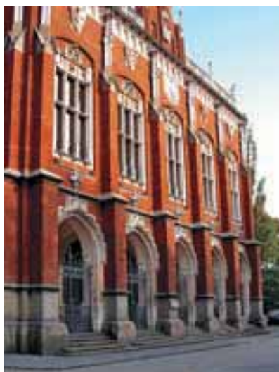
Uniwersytet Jagielloński w Krakowie

Według Jezusa być władcą to znaczy służyć. Święta Jadwiga doskonale to rozumiała. Jan Długosz opisuje jedną z wielu podróży pary królewskiej po kraju.