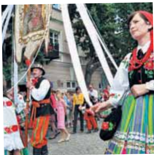
Procesja Bożego Ciała w Łowiczu