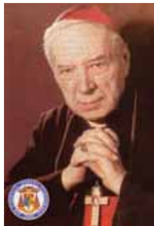
Kard. Stefan Wyszyński

Kardynał Wyszyński odegrał niezwykle ważną rolę w latach pięćdziesiątych (czasy komunizmu), kiedy to władze PRL wypowiedziały wojnę Kościołowi. Władający zniewoloną Polską komuniści chcieli zastraszyć Kościół – ostatnią instytucję opierającą się ich rządowi. Dlatego nocą 25 października 1953 r.