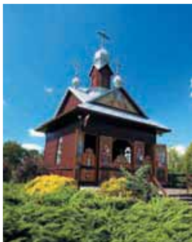
Kaplica pw. Przemienienia Pana Jezusa na górze Tabor w parafii unickiej w Kostomłotach na Podlasiu

Od średniowiecza Polska była krajem wielowyznaniowym. Już w XIV w. w granicach naszego kraju żyli katolicy i prawosławni. Oprócz tego mieszkali w nim wyznawcy judaizmu i muzułmanie.