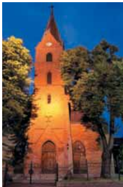
Kościół protestancki w Olsztynie

Wszystkie te grupy wyznaniowe i narodowościowe cieszyły się własnym samorządem i korzystały ze stosunkowo rozległych swobód religijnych. Było to możliwe dzięki polityce tolerancji wyznaniowej, która znalazła swój pełny wyraz w słynnym akcie konfederacji warszawskiej, uchwalonym na sejmie konwokacyjnym (6–29 stycznia 1573 r.). Pod koniec obrad sejmowych, które miały na celu wybór nowego króla, postanowiono, że Polacy, tak jak ich przodkowie, będą się starali zachować między sobą pokój, sprawiedliwość i porządek, a różnice wyznaniowe nie będą powodem do przelewania krwi ani wymierzania kar. Był to pierwszy w Europie akt gwarantujący tolerancję religijną.