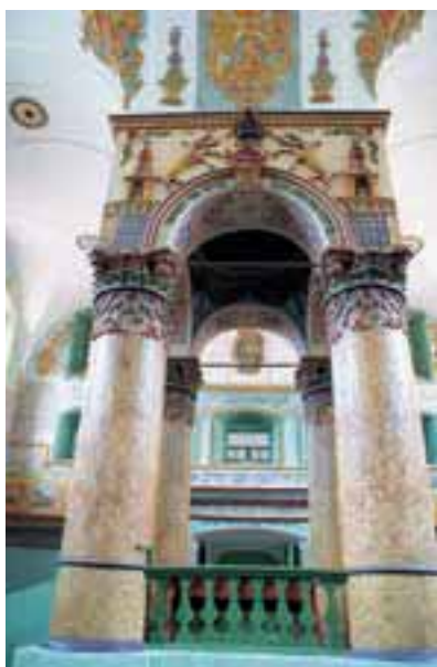
Wnętrze synagogi w Łańcutcie

Cudzoziemcy podróżujący po naszym kraju dziwili się, że nieraz w tych samych miastach znajdowały się świątynie różnych wyznań chrześcijańskich. Należy równocześnie pamiętać, że w większości polskich miast istniały synagogi.